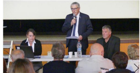
La prochaine réunion publique se tiendra à Champigneulle le 18 octobre.

Le PLUI intègre, en effet, différents diagnostics et enjeux en termes de développement. Il concerne de nombreux domaines : économie, écologie, tourisme, circulation et déplacements urbains, logement, équipements, paysages. Le plan impactera directe-