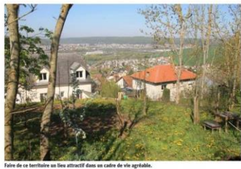
Faire de ce territoire un lieu attractif dans un cadre de vie agréable.